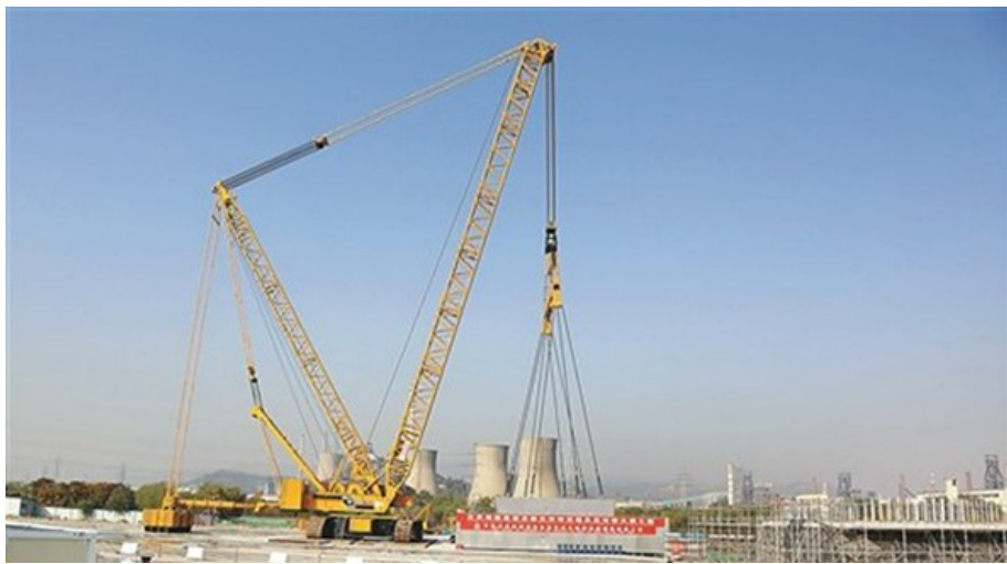
徐工新时代创新高。

为了深入学习贯彻十九大精神,学习运用先进经验,更好谋划明年,推动我县工业创新争先发展上新台阶,近日,县工业研究中心组织赴徐州市学习考察。初冬淮海大地,沐浴十九大阳光,春意盎然,春潮涌动,徐州干群昂首新时代,阔步新征程,以新创造、新业绩书写古运河最美的新篇章。